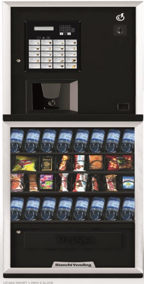
LEI300 SMART + ARIA S SLAVE

Minimale ruimte voor een maximaal aantal producten. LEI300, Automaat voor warme dranken met een capaciteit van 300 bekers en met de verfijnde stijl van het Lei lijn. In combinatie met Aria S wordt LEI300 een combi Hot & snack distributeur, ideaal voor kleine en middelgrote locaties.